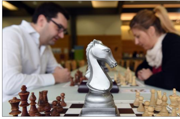
■ Le trophée des « parties rapides »...

Nancy. Si on ne sait pas quoi faire des hôtels départementaux, le jour où il n'y en aura plus, faute de Départements, on pourra toujours les reconstruire en chancelleries des Echiquiers. La preuve est faite depuis ce week-end que la configuration des lieux est idéale.